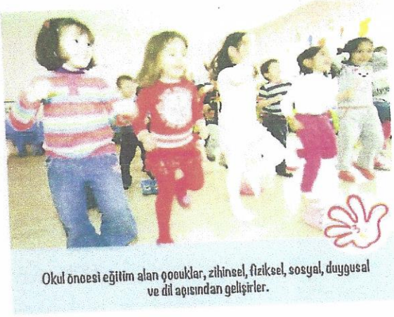
Okul öncesi eğitim alan çocuklar, zihinsel, fiziksel, sosyal, duygusal ve dil açısından gelişirler.

TAV ile uzun vadeli işbirliğimiz bu sene de devam etmiştir. Şirket 333 çocuğun 1 sene boyunca okul öncesi eğitime kavuşabilmesi için 100.000 TL bağışlamıştır.